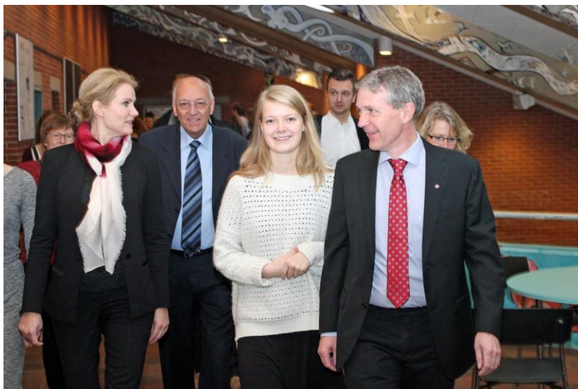
”Statsministeren på besøg på Favrskov Gymnasium den 15. november 2013.”

Med personlige lykønskninger fra de fire ministre sender de også signalet om, at vi alle har ydet en stor indsats i Favrskov