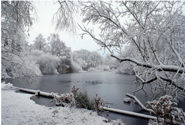
Rønbæksøen ved Hinnerup.